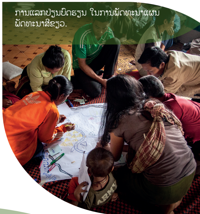
ການແລກປ່ຽນບົດຮຽນ ໃນການພັດທະນາແຜນພັດທະນາສີຂຽວ.

ອົງການແຄຣ໌ ນານາຊາດ ປະຈຳ ສປປ ລາວ ຫ້ອງການ ນະຄອນຫຼວງວຽງຈັນ ຕັ້ງ.ນ 4328, ຖະໜົນໜອງສ້າງທໍ່, ບ້ານ ໜອງສ້າງທໍ່, ເມືອງ ໄຊເສດຖາ, ນະຄອນຫຼວງວຽງຈັນ, ສປປ ລາວ ໂທ: (856-21) 217 727