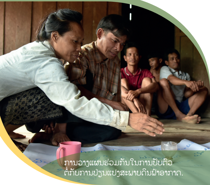
ການວາງແຜນຮ່ວມກັນໃນການປັບຕົວຕໍ່ກັບການປ່ຽນແປງສະພາບດິນຜ້າອາກາດ.